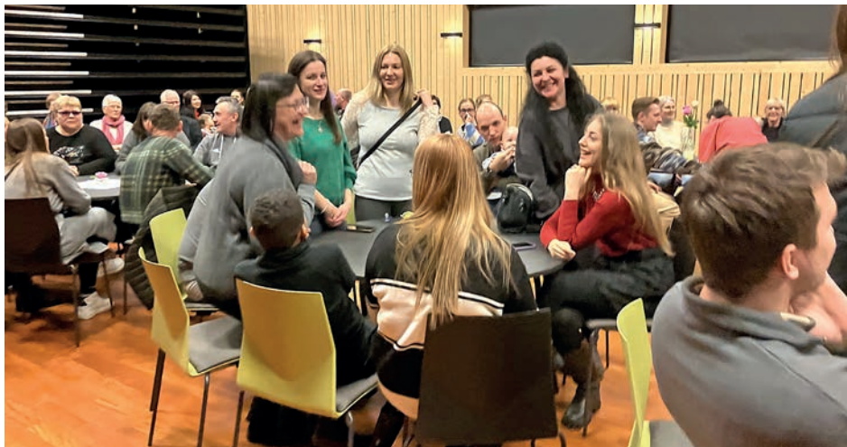
God stemning på Bygland kulturscene med smilande Ukrainarar og Byglendingar!

Nemnast må trommeslagaren! For nokre slår på trommer, medan andre spelar på trommer! Og spela