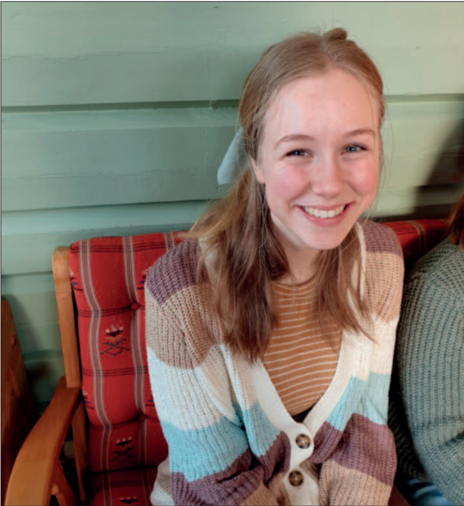
Trusopplæreren i godlage.