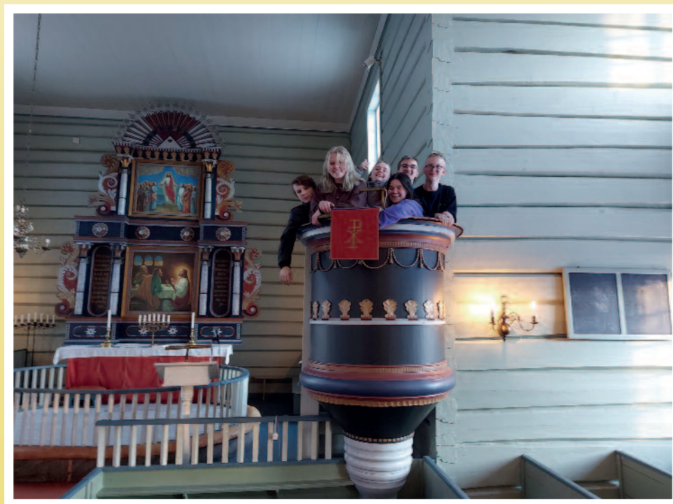
Glade konfirmantar på preikestolen i Bygland kyrkje.