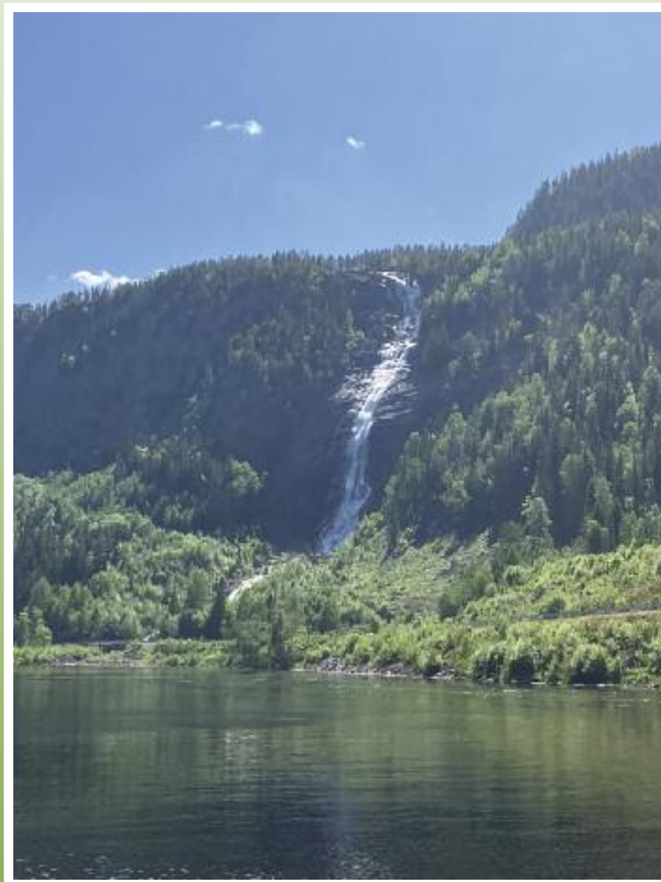
Reiårsfossen i sommarsol.