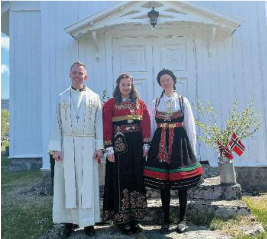
Konfirmasjon Austad kyrkje Tveit laurdag 20. mai.