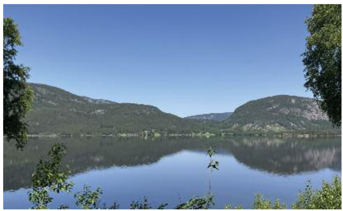
Sommarmorgen mot Frøyraak.