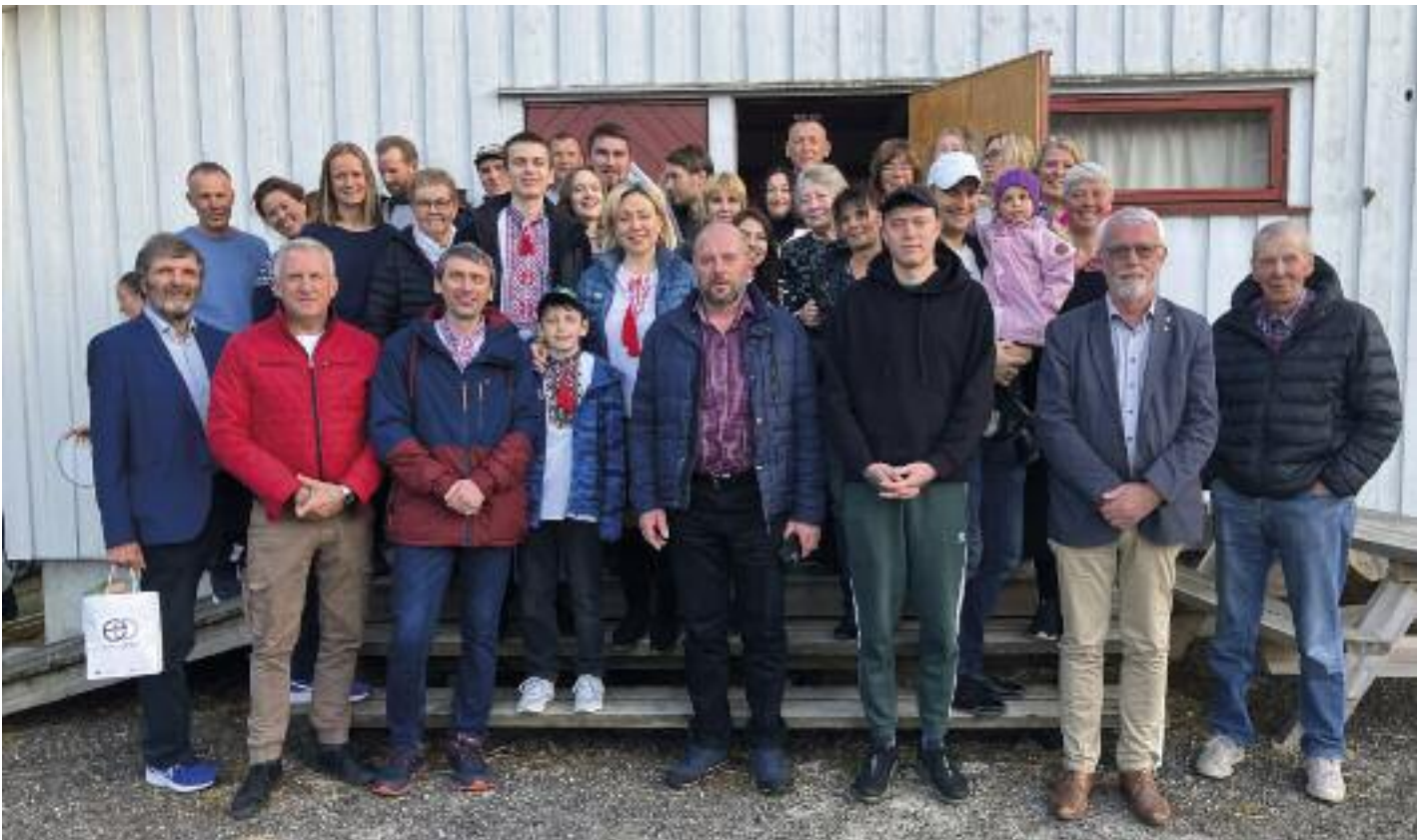
Gilde Byglendingar og Ukrainarar samla utanfor Vonheim bedehus.

Der var og ein stor flokk Byglendingar, og då det vart arrangert Quiz var det heilt naudsynt med ei salig blanding av Byglendingar og Ukrainarar for å klara spørsmåla, som vekselvis handla om både norske og Ukrainske emne. To av borda hadde jamvel 10 av 10 rette!