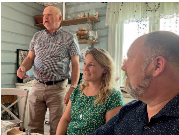
150-årsjubileum i Åknes kapell