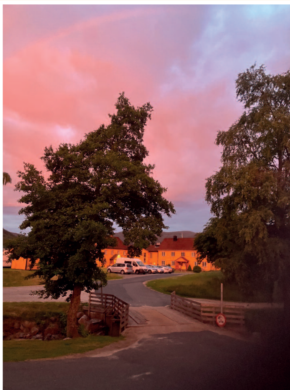
Sommarmorgon over KVS Bygland.