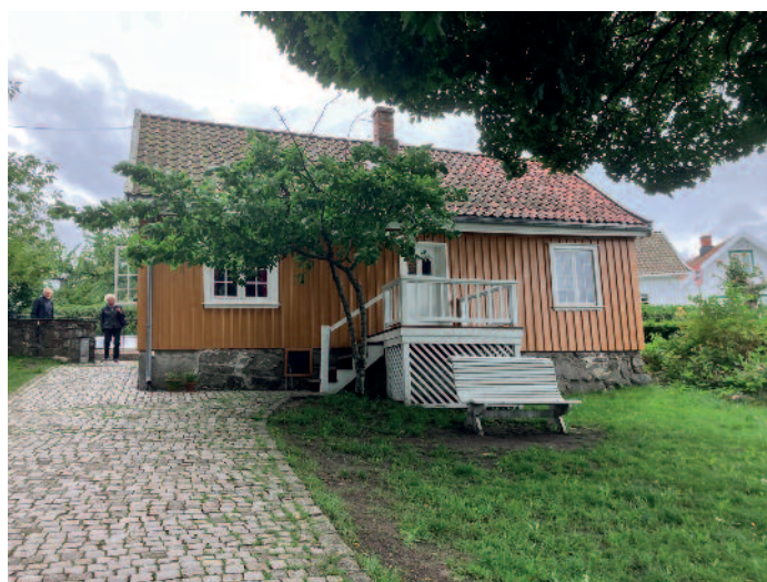
Munchs hus i Åsgårdstrand.