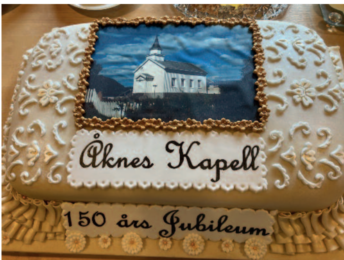
Jubileumskaka før ho vart spretta.

Frå sjøle vigslinga kan ein lesa at dagen rann med strålende ver, og at bygda fekk syna seg i den fagraste haustskrud. Vidare kan ein lesa: "Som ein spegel laag Lognavatnet der og spegla attende alle fagerdomen fraa dei fargerike lier. Og midt i all denne venleiken stod det nye Kapellet, ukledt og einfelt, men omringa av spaning og varme tankar og peika med taarnet op i den klare lufta, høgt, heilt opp til Gud"