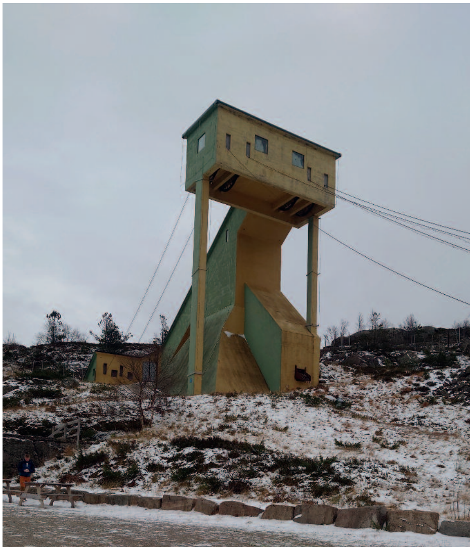
Gruveanlegget på Knaben.

Denne helga var det kald vind og minusgrader. Den første snøen kom også denne helga. Så bussen som skulle hente oss attende vart ståande i Tveitekleivane. Så måtte dei få ein annan buss heim att. Den vart sjølvsagt forseinka. Men det gode humøret til konfirmantane let seg ikkje påverke i særleg grad av det.