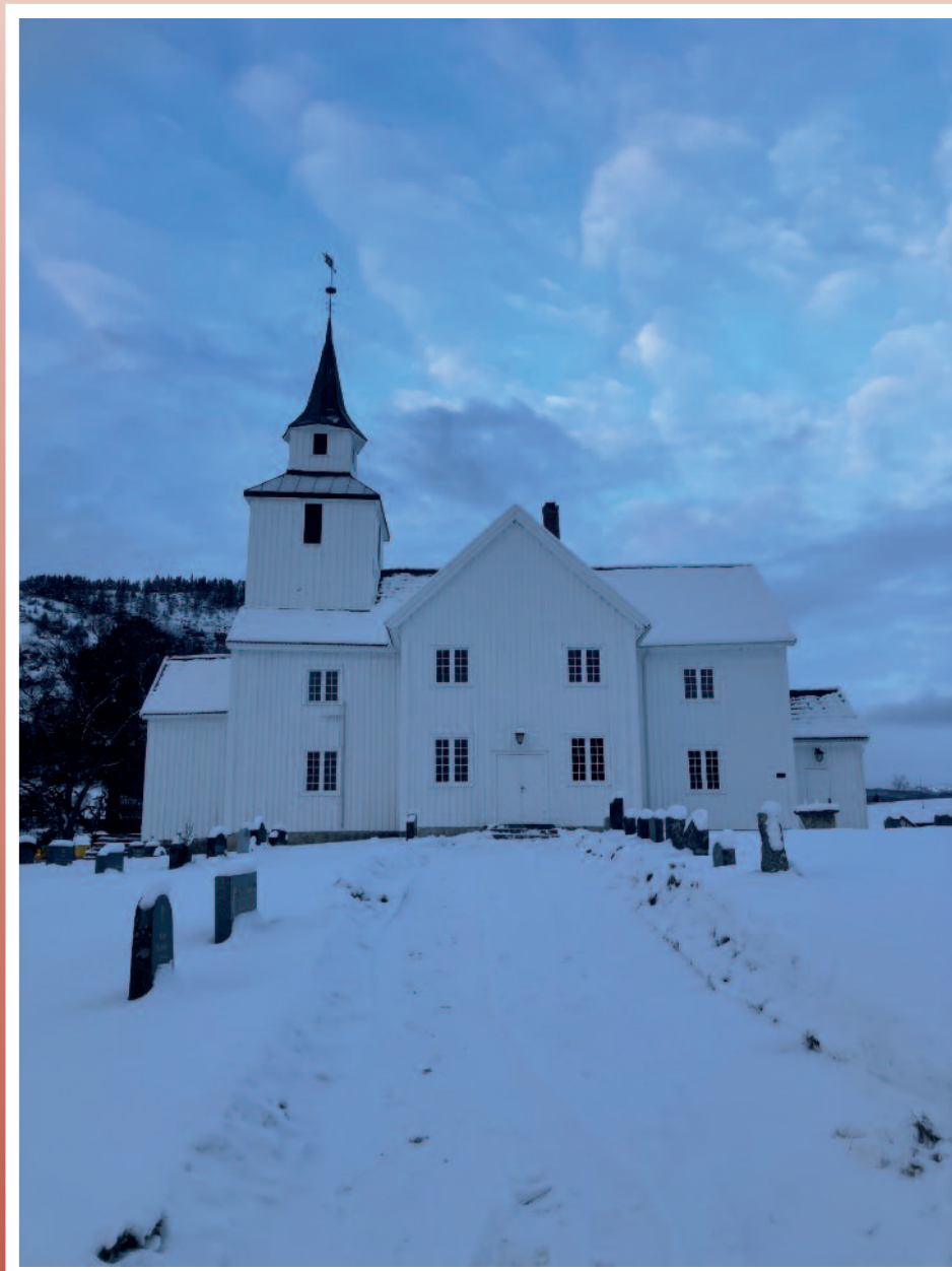
Bygland kyrkje i vinterdrakt