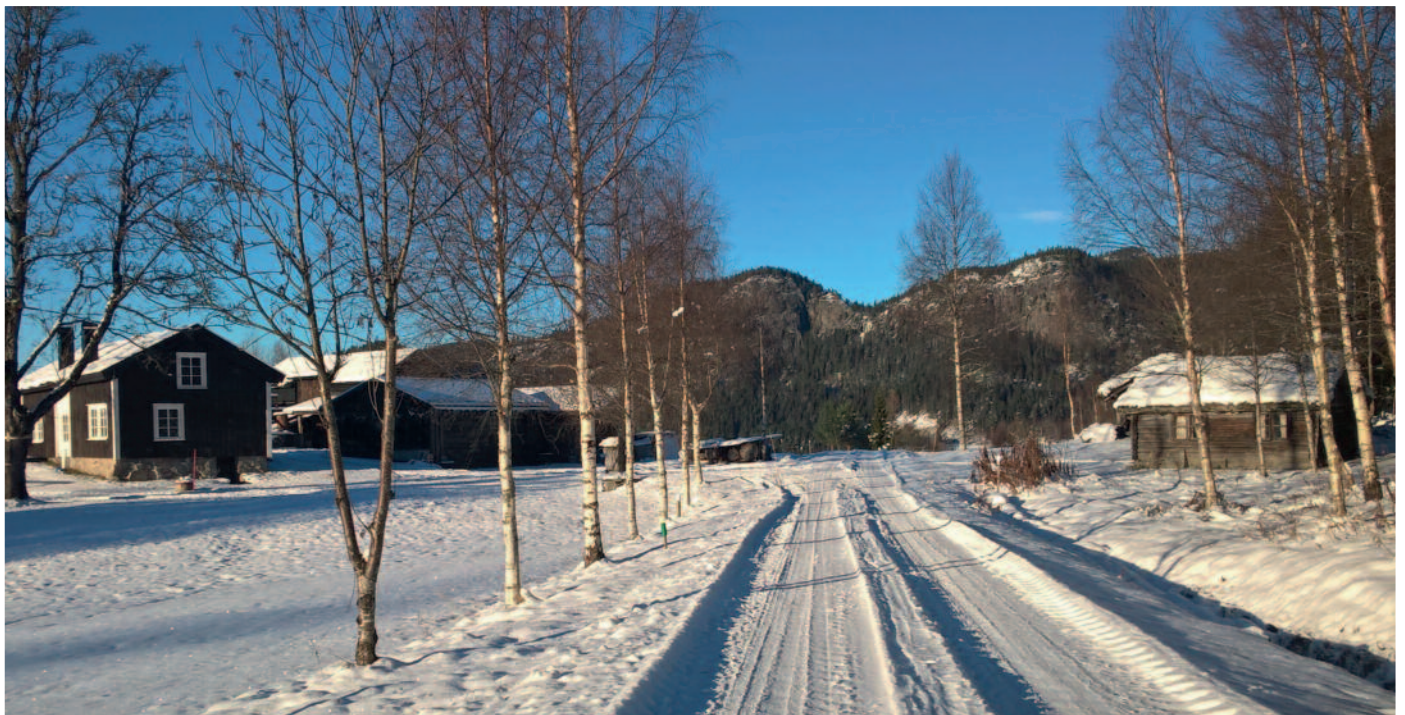
Vinter på Segberg i Åraksbø.