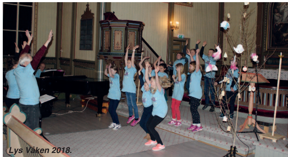
Lys Våken 2018.

Kvelden vart avslutta med ein andakt inne i altarringen. Der fortalde presten at kyrkja var det tryggaste huset ein kunne sove i, for der var Jesus til stades på ein spesiell måte. Her er eit bilete frå danseøvinga.