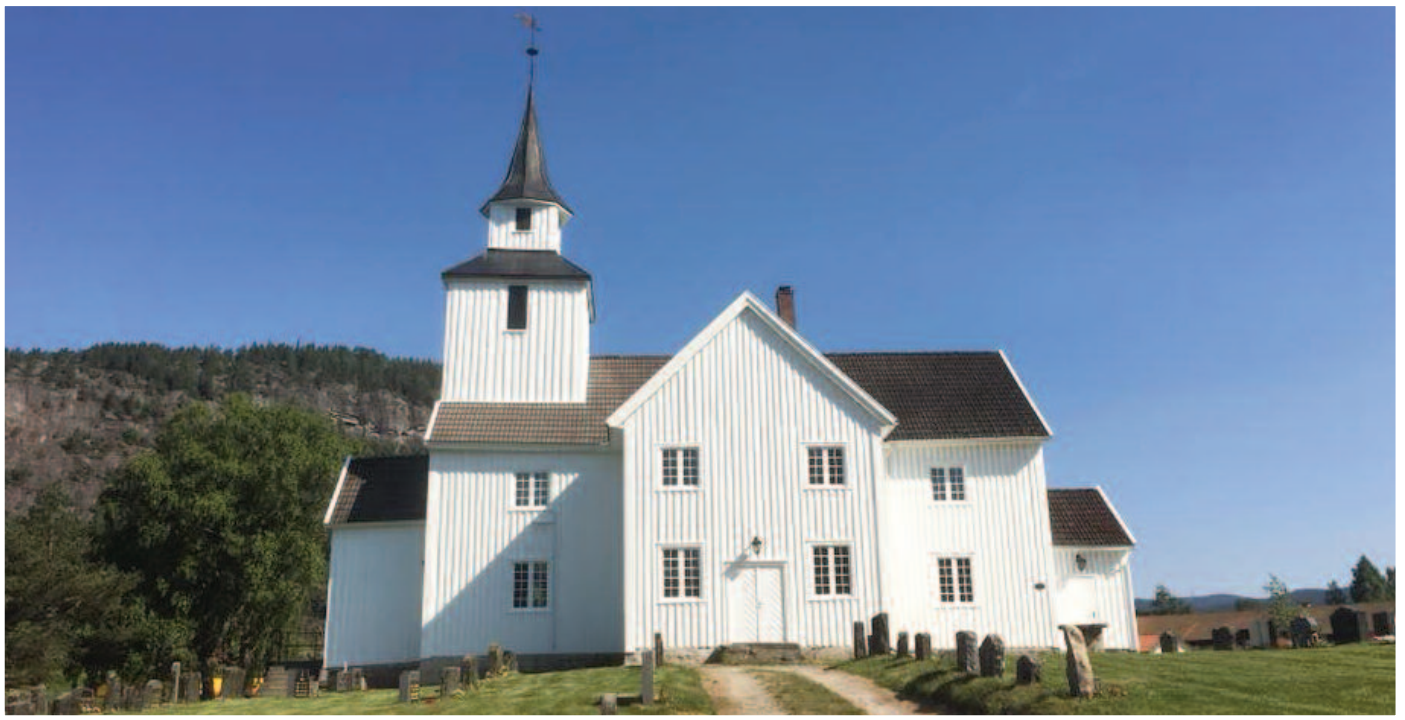
Nymåla Bygland kyrkje.