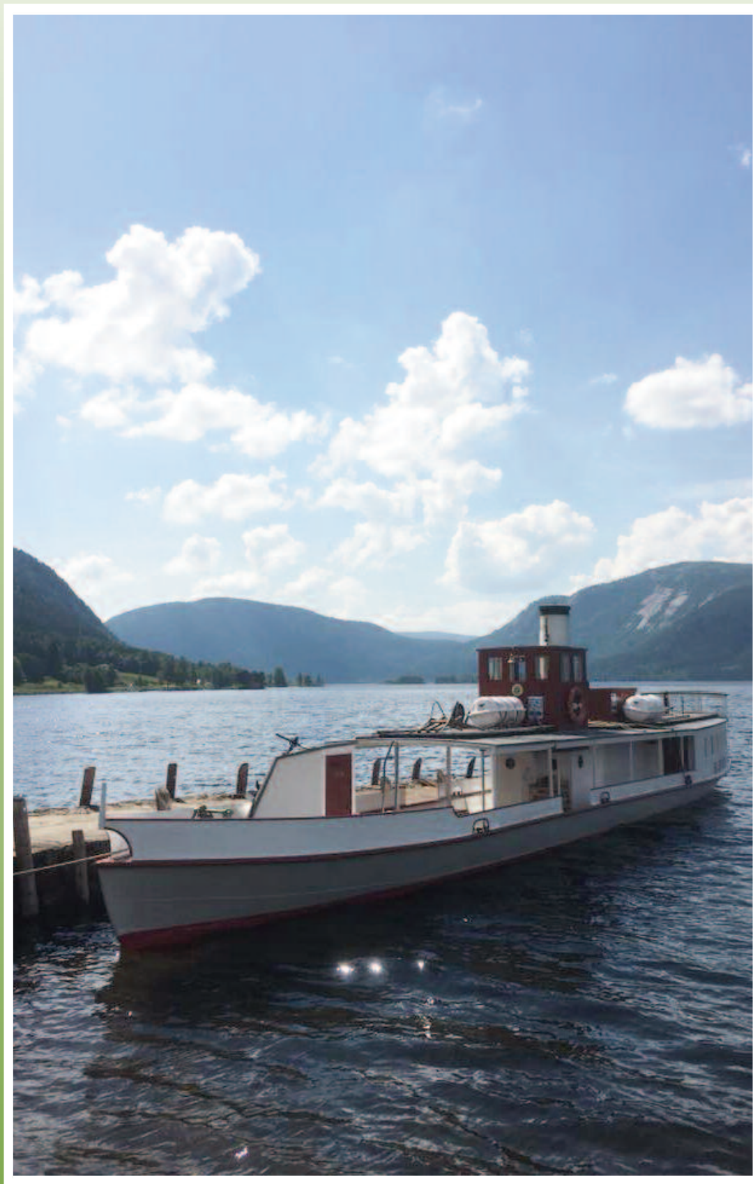
DS Bjoren ved Bygland brygge

Returadresse: Setesdalstrykk a.s Kinovegen 16, 4735 Evje