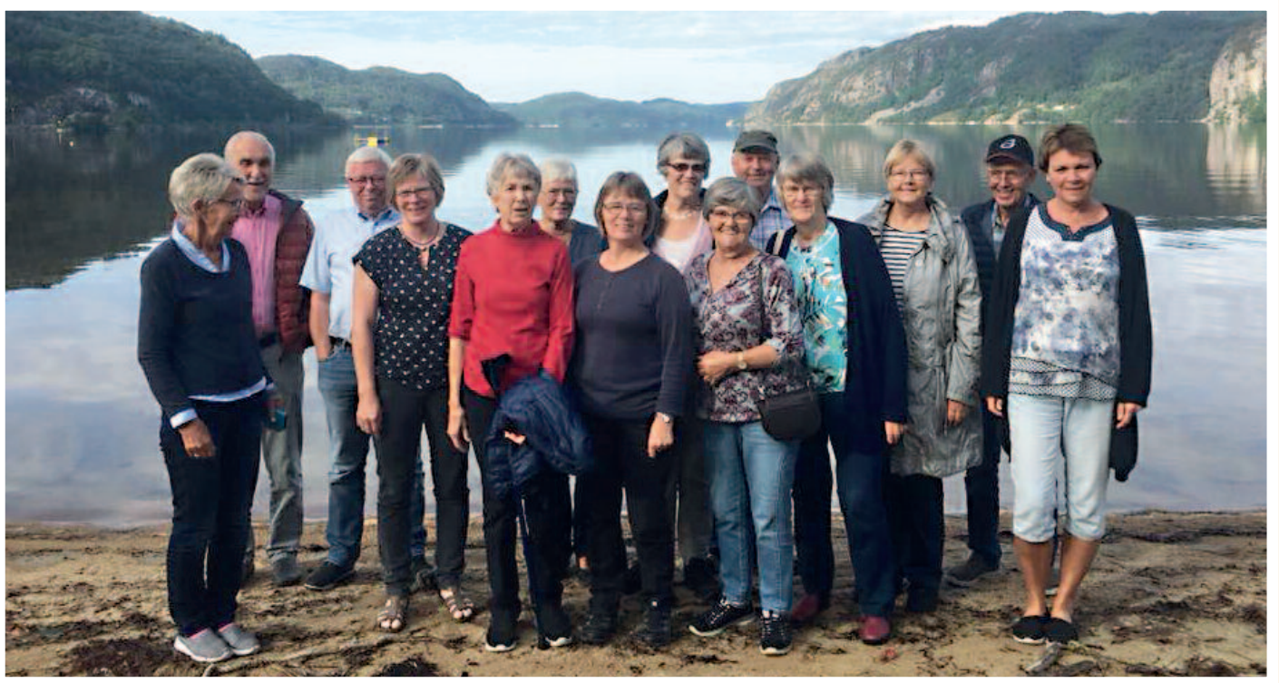
Godtfolk frå Bygland på Kvavikstranda i Lyngdal