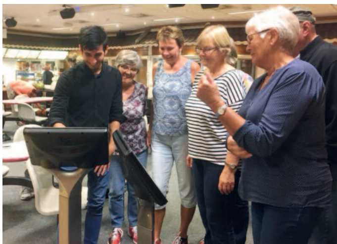
Innføring i bowling-livets gleder.

Det vart seint før me tok på heimveg, og etter den siste etappen på vestsida av fjorden var det godt å koma heim att og krypa under fellen. Med mange gode opplevingar i minnet!