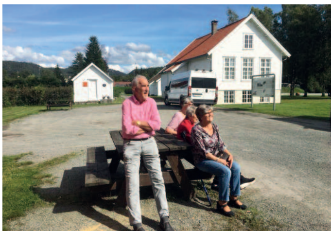
Besøk på skule- og misjonsmuseet