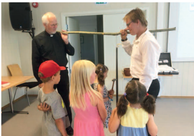
Borna ringer inn til gudsteneste

Heile 70 deltakarar i alle aldre var med og sette sitt preg på gudstenesta, og etterpå vanka det god og velsmakande sundagsmiddag nede i matsalen på KVS Bygland.