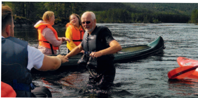
Presten fekk til og med redda skoa sine da kanoen gjekk om kull.