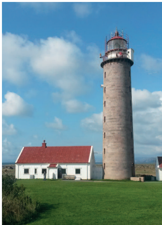
Lista fyr.