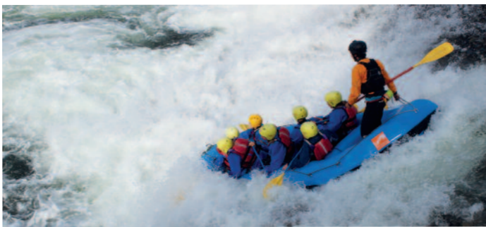
Det gjekk friskt for seg ned Syrtveitfossane.