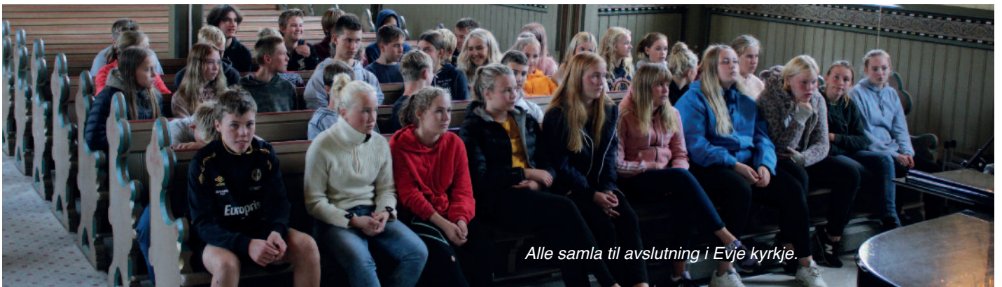
Alle samla til avslutning i Evje kyrkje.

Laurdag den 1. september var dei 15 konfirmantane frå Bygland saman med Evje og Hornneskonfirmantane med på eit såkalla Kick-off.