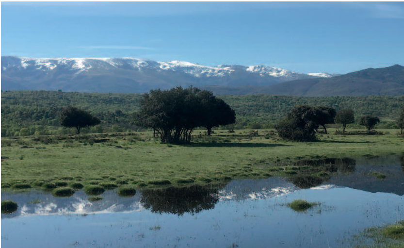
Snødekte fjell over Sierra de Gredos.