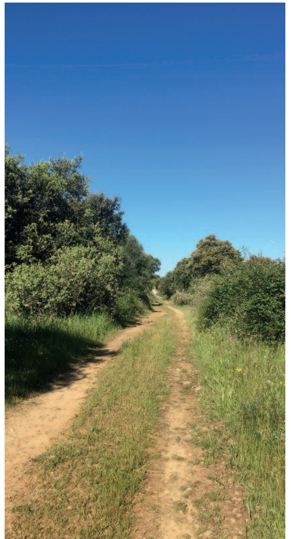
«Jeg gikk en tur på stien».