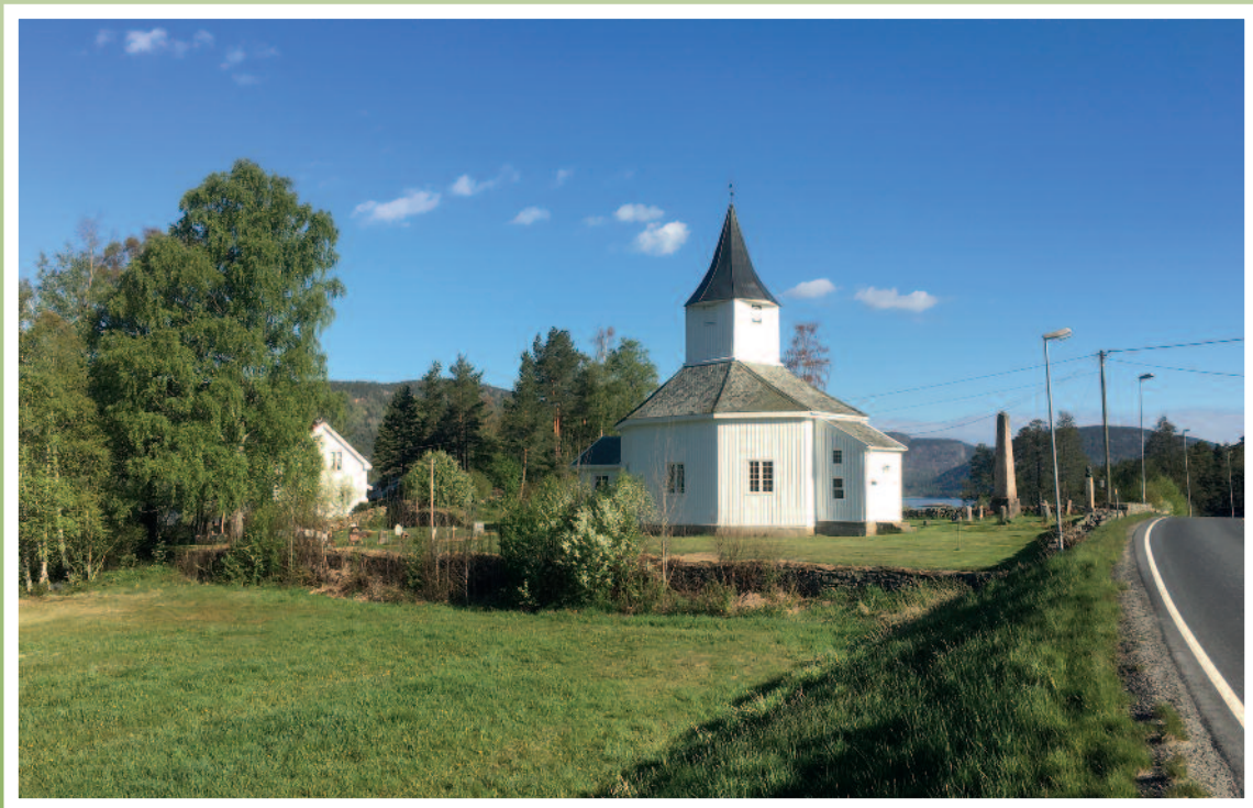
Årdal kyrkje i sommardrakt.