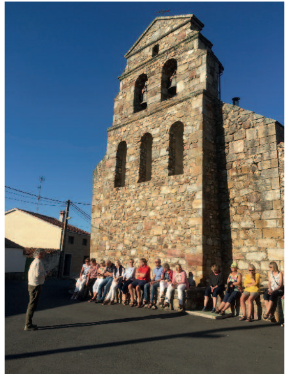
Allsong på kyrkjetrappa i San Pedro de Rozades.