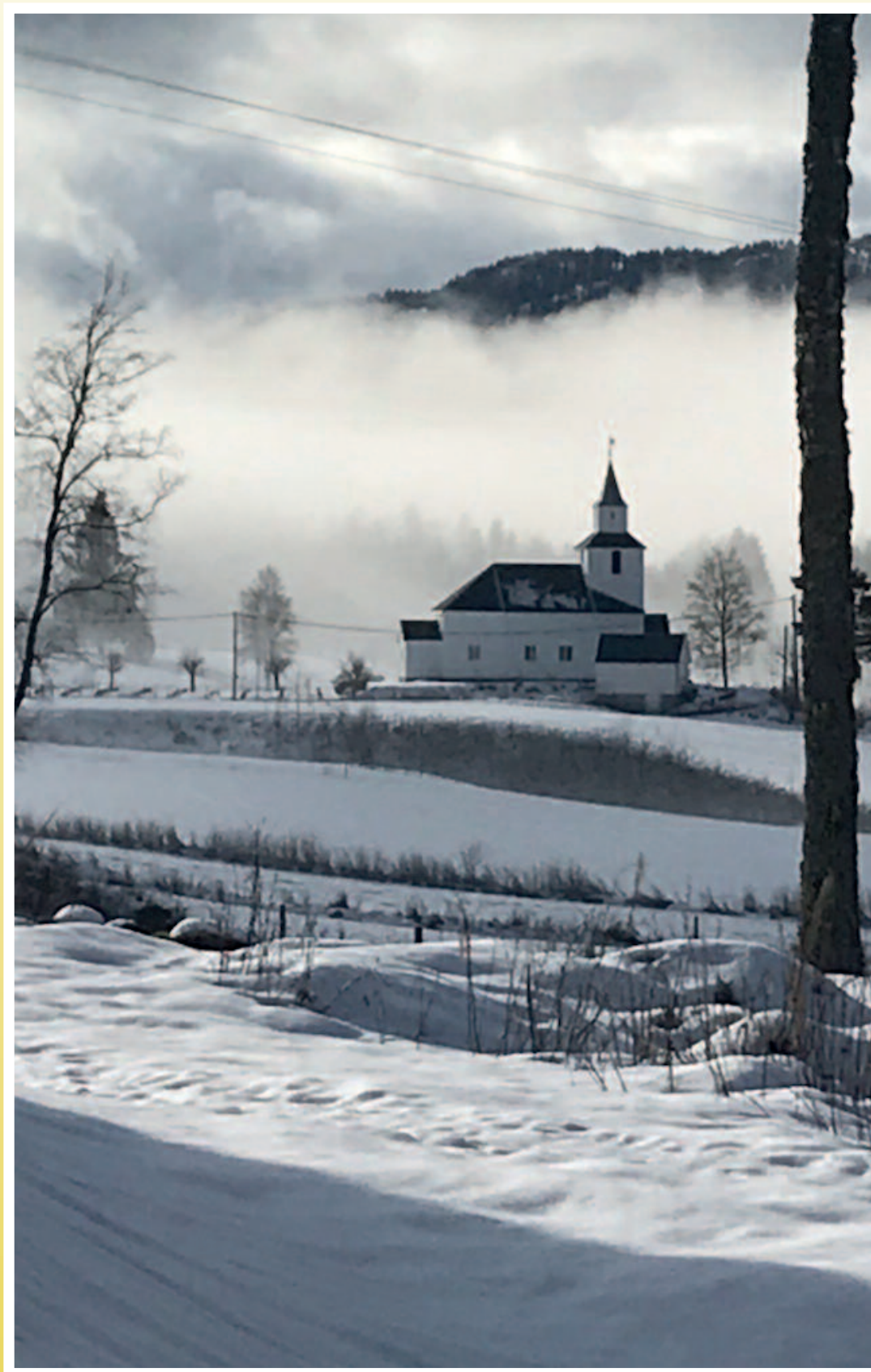
Sandnes kyrkje ein fager vinterdag.