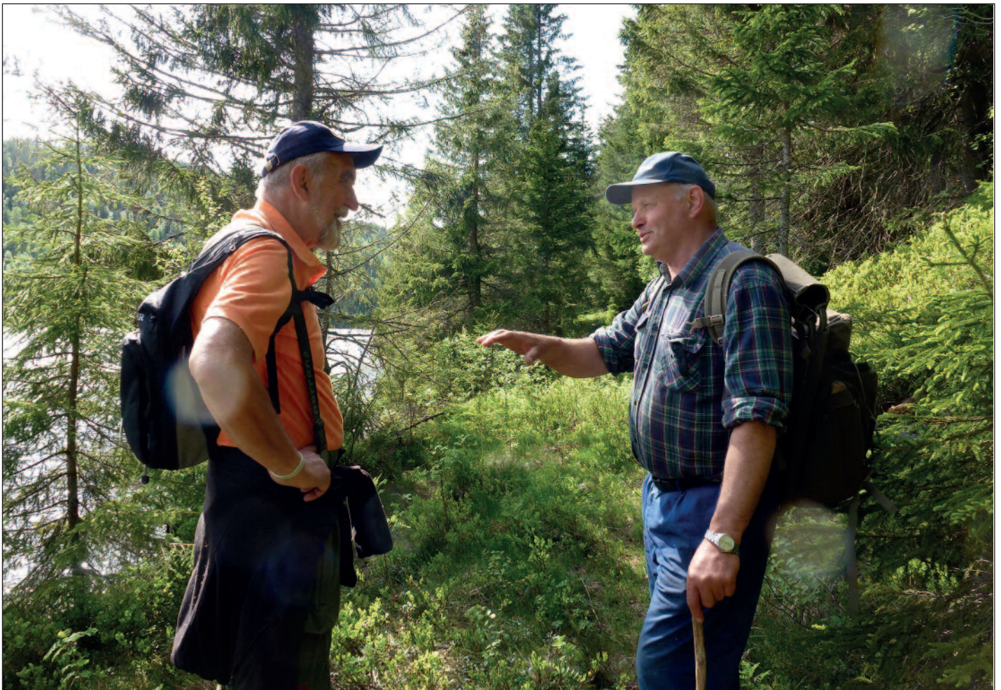
Kyrkjetenaren og klokkaren etter debriefinga.